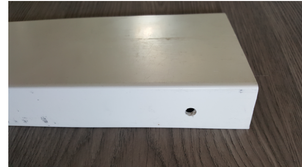
PORAA IKKUNALISTOIHIN 8MM ESIREIKÄ LÄMPÖLAAJENEMISEN TAKIA!

ensimmäisenä asennetaan lista a, listan 160mm selys katkaistaan oikeaan mittaan (eli smyygin syvyys mitta) HUOM, ennen listan asennusta kannattaa asentaa akkunapelli paikalleen näin vesi virtaa listojen päältä akkunapellille eikä saumoista sisään. HUOM, lista a:ta ei asenneta ikkunan alaosaan koska akkunapelli peittää alaosan ikkunasta. Seuraavaksi asenna lista b, tee tarvittavat lovetukset reunoihin niin että saat asennettua lista b:n ikkunan smyygin väliin, rakenne kuvassa näkyy miten listat kiinnitetään ja limitetään yhteen ruuvilla, HUOM! Poraa esireiät 8mm poralla ennen ruuvien kiinnitystä ja älä kiristä liikaa, näin ollen jää varaa lämpölaajenemiselle joka saattaa olla ääriolosuhteissa jopa 10mm jos kohde asennetaan talvella. älä myöskään asenna lista a:ta tai b:tä liian tiukasti ikkunan karmiin väliin, sinne on myös jätettävä parin millin rako molempiin päihin. tiivistä tarvittaessa silikonilla. Tai leikkaa kulmiin 2x2 cm valkoinen karmi kulmapelli, näin rako ei näy ja on tiivis.